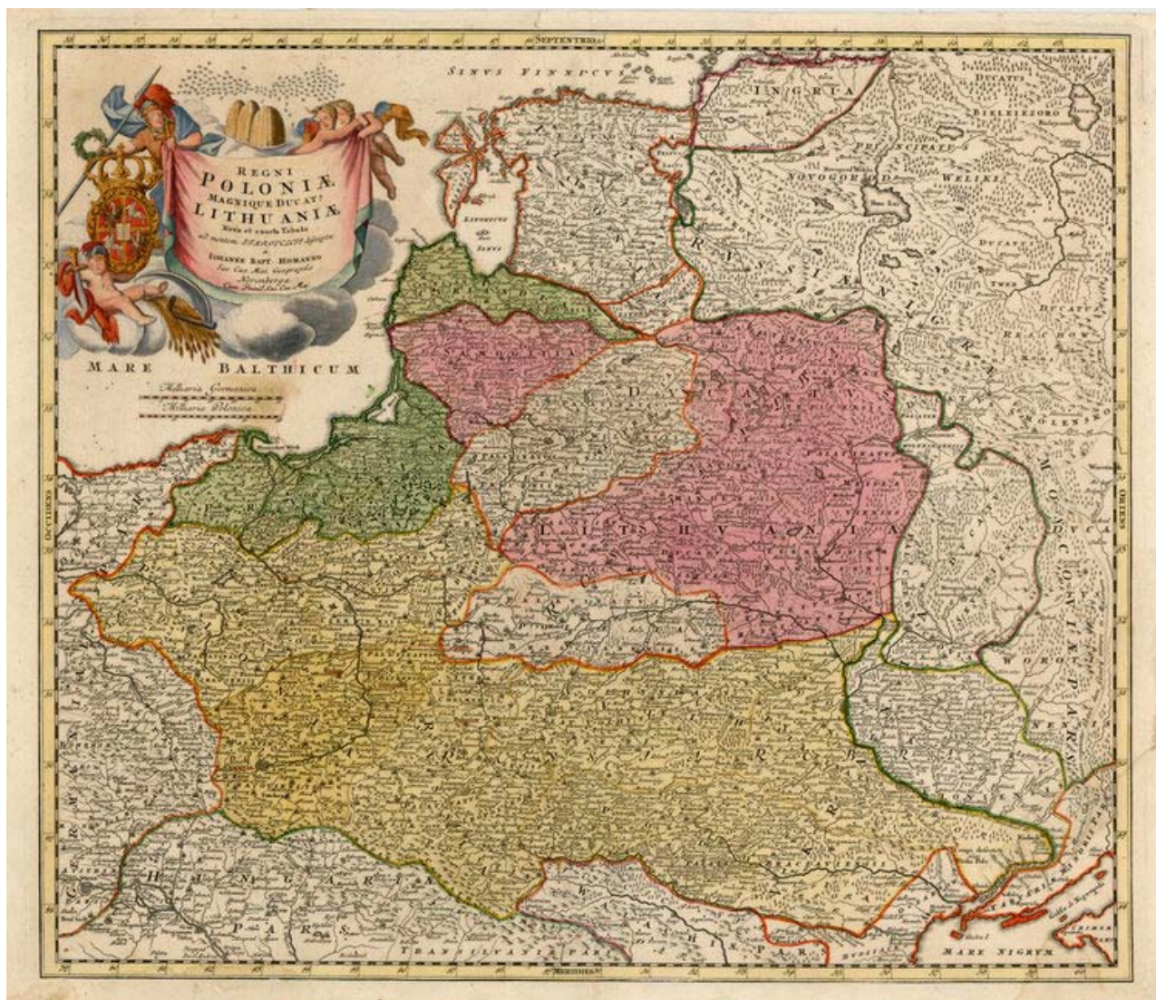
ATR, XVIII a.

Kad pakeistų nepalankią situaciją ATR viduje, vadovai ėmėsi įvairių sričių reformų plano. Viena pagrindinių reformų ir buvo nauja ATR Konstitucija, priimta ir pavadinta Gegužės 3-osios vardu. Lenkijos karalystė šią Konstituciją aiškiai palaikė, palaikė ją ir tuometinis Vilnius, nes Jis buvo tikras „unijos“ forpostas Lietuvoje, labai sulenkėjęs, nepriklausomas nuo lietuviškos periferijos miestas. Tačiau Vilnijos periferija, kaip ir visa Lietuva, tuomet buvo lietuviška, pasisakanti už LDK savarankiškumą provincija, todėl ir čia vykstantieji istoriniai procesai skyrėsi nuo tų, kurie vyko pačiame Vilniaus mieste. Katalikų Bažnyčia Vilniaus vyskupo Ignoto Jokūbo Masalskio, Verkių rūmų statytojo, Vilniaus katedros rekonstrukcijos fundatoriaus ir pirmojo Edukacinės komisijos pirmininko LDK teritorijoje asmenyje, prieštaraudama sulenkėjusių Lietuvos didikų iniciatyvai sulenkinti kraštą, ėmėsi nešališkų žingsnių, kad gyventojai savo vaikus galėtų mokyti Šv. Rašto gimtąja kalba. Mūsų žiniomis Vyskupo iniciatyva buvo steigiamos ir lietuviškos mokyklos, kurių